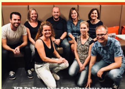
MR De Neerakker Schooljaar 2018-2019 MR-leden van het schooljaar 2018-2019

Van alle MR vergaderingen worden de agenda's en notulen op de schoolsite gezet.